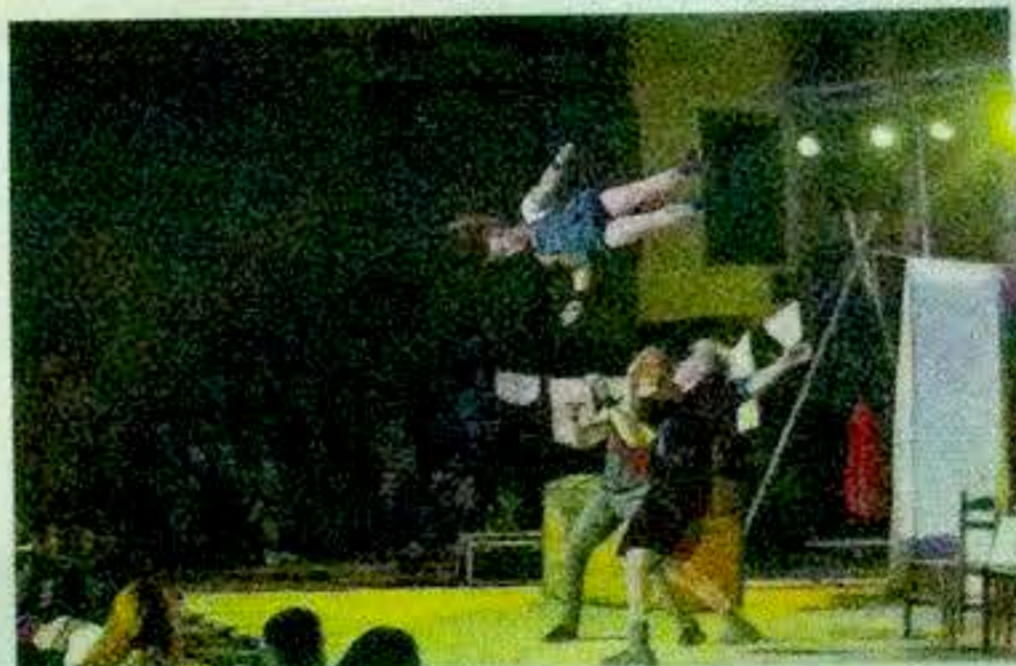
Una de las integrantes de la compañía, en pleno vuelo.